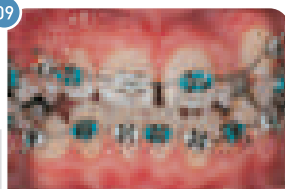
Aparelho Ortodontia | Cor