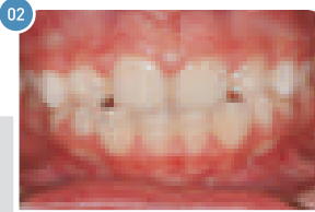
Criança de 7 anos | Depois do uso do aparelho