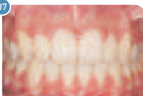
Adulto | Depois do uso do aparelho