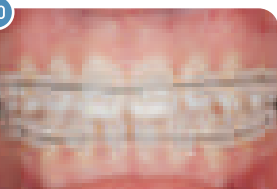
Aparelho Ortodontia | Cerâmico