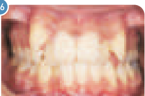
Adulto | Antes do uso do aparelho